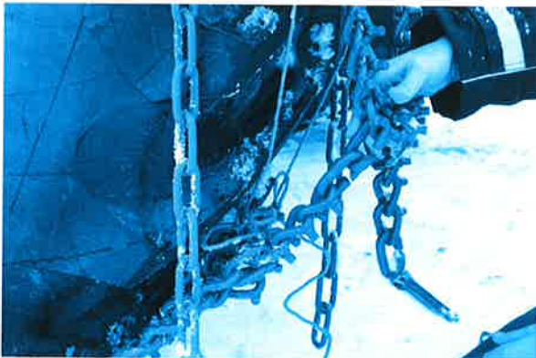
5. Wenn sich die Kettenenden treffen, verbinden Sie die Glieder mit den Schlitzringen.