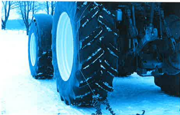
3. Geben Sie das Seil auf den Reifen.