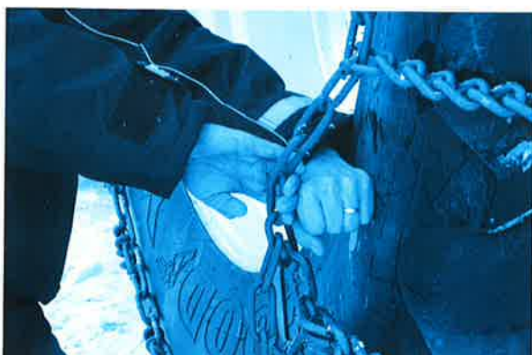
7. Eine gute Regel ist, dass Ihre Hand zwischen den Reifen und die Kette passen sollte. Nicht zu fest anspannen. Überprüfen Sie die Straffheit der Schäkel.