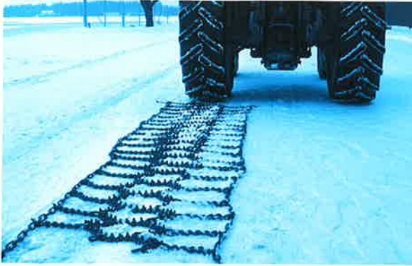
1. Legen Sie die Ketten hinter den Reifen mit den Halterungen vor dem Traktor und den Spikes nach oben.