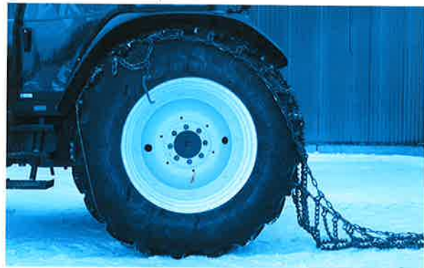
4. Fahren Sie eine Umdrehung vorwärts, halten Sie die Kette eng beisammen.