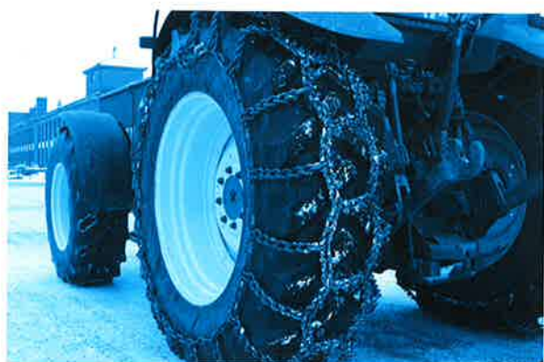
8. Überprüfen Sie die Straffheit der Kette durch eine kurze Testfahrt.