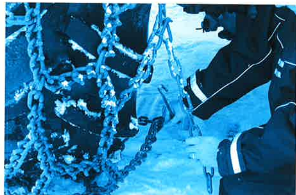
6. Befestigen Sie die Kette mit den Halterungen zuerst innen und dann außen.